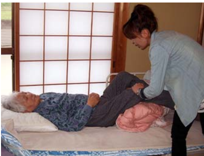
お客様からの『ありがとう』が私達の元気の源です。