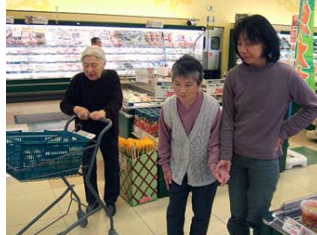
ある日は地区のスーパーへ

「麻姑のや」は、毎日笑いが絶えません。元来ノリのいいスタッフに、お客様も『しゃーねーなー。』とお付き合いしてくださっているのでしょう。本当にスイマセン(by 村長)