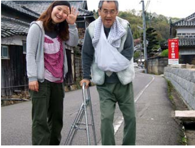
天気の日には外をお散歩♪