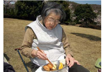
もちろん寛いでも頂けます。

ってもらい生活リハビリにつながっています。またある日はお手製弁当を持ってお花見。