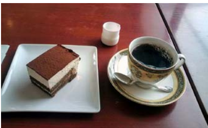
ティラミスとコーヒーを♪絶品！