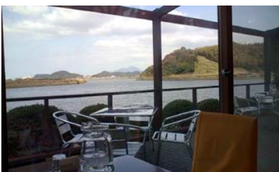
「カフェロッソ」店内から中海を望む