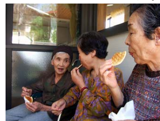
また地元の和菓子職人