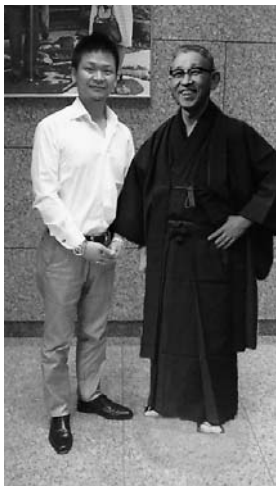
故松下幸之助翁のパネルと

先日、日頃お世話になっている経営者の先輩方と一緒に、滋賀～京都方面に経営の勉強に行ってきました。優秀な企業を見学させていただき、その社長の苦労話を聞いたり、一緒に食事をした後討論会を行ったりと、まだまだ未熟な私にとってとても刺激的でした。2日目は京都にある松下資料館へ。松下資料館は