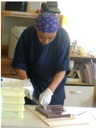
この道30年の職人技！