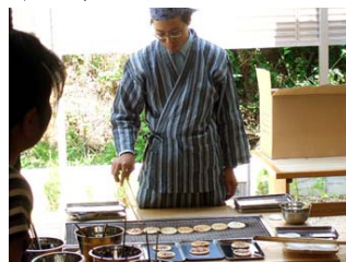
昔畠山で働いていたお客