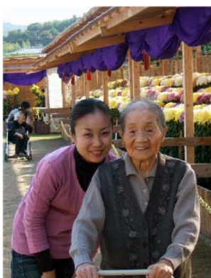
しっかり散歩もしています♪

毎年この時期になると、色とりどりのすばらしい花を咲かせる菊達。菊作りをされている方々のお庭では、たくさんの菊が出展の出番を待っていることでしょう。今年も長船町公民館では、普段見ることの出来ないほどたくさんの菊が凛々しく並んでいました。その種類も様々！！